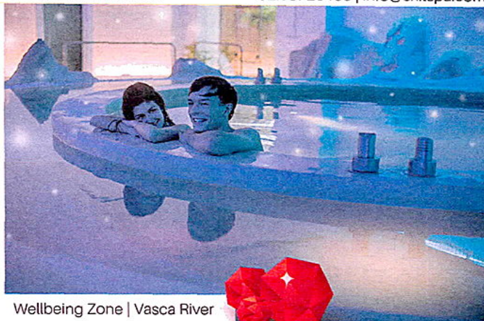
Wellbeing Zone | Vasca River

Via Ungaretti 52 | Saronno (VA) 02.36726163 | info@exitspa.com