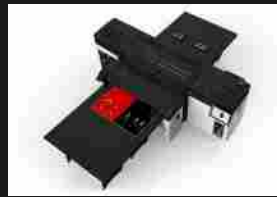
HP: 10 anni di tecnologia Latex