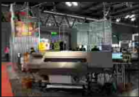
Ricoh presenta due nuove soluzioni latex per il mercato Sign and Display