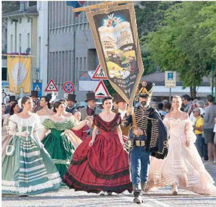
CORTEO La sfilata con i meravigliosi costumi d'epoca