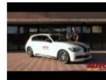
BMW M performance 2:40 Autotecnica ha provato per voi la BMW M Performanc...