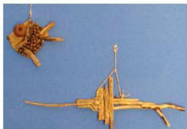
Pesci Opere dell'artista Tiziana Mazzara facenti parte del progetto creativo Eco-Fish

http://www.creathead.it/italian/creativi/artista/catania/43849/tiziana-gazzara