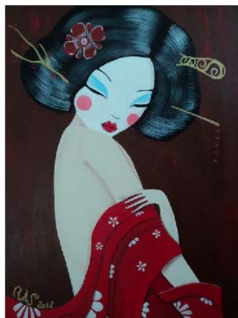
Aimi: amore per la bellezza Opera dell'artista Roberto Santangeli

http://www.creathead.it/italian/creativi/artista/messina/43741/roberto-santangelo