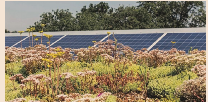
Particolare dei tetti verdi realizzati da Manini Prefabbricati, che coniugano risparmio energetico e taglio di emissioni di CO 2

Un mercato per cui l'aspetto economico-finanziario è un altro fondamentale punto di forza di Manini Prefabbricati, che affonda le sue