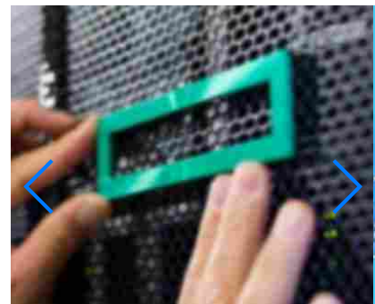
HPE Innovation Lab, la tecnologia sul territorio con i partner