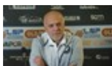
16 dic 2021 Sport