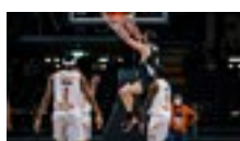
16 dic 2021 Sport