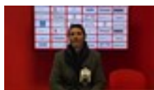
14 dic 2021 Sport