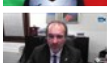
04 dic 2021 Sport