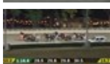
12 dic 2021 Sport