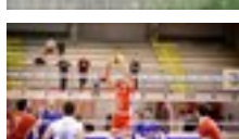
13 dic 2021 Sport