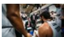
15 dic 2021 Sport