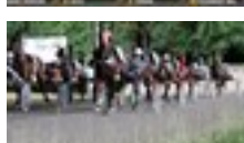
10 dic 2021 Sport