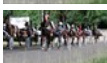
05 dic 2021 Sport