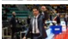
15 dic 2021 Sport