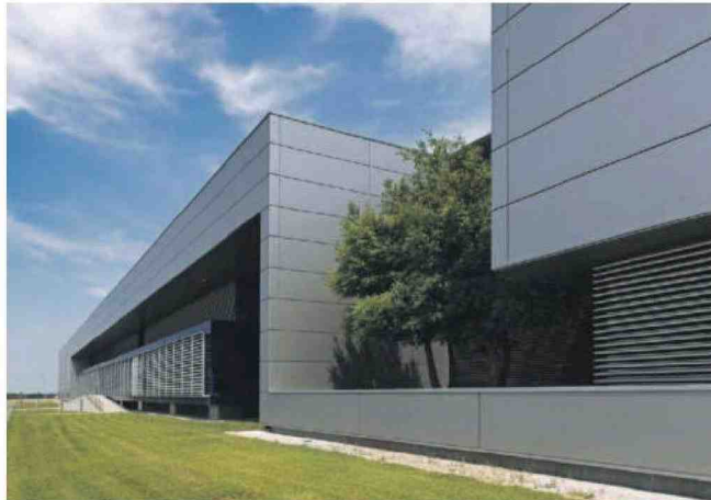
Gruppo Metallmeccanica Tiberina: la sede produttiva di Suzzara (MN) è stata ampliata di 11.400 m 2 con le soluzioni Manini Prefabbricati SpA