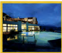
Eco SPA Lefay Resort & SPA