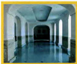
Destination SPA Capri Tiberio Palace & SPA