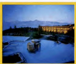
Destination SPA Hotel Adler Thermae SPA & Relax Resort