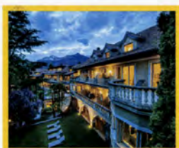
Medical SPA Villa Eden Leading Health Merano