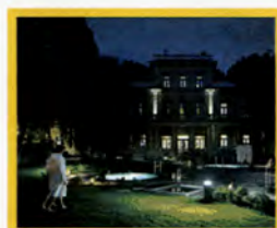
Urban SPA QC Terme Torino