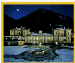
Destination SPA Bagni di Prè Saint Didier