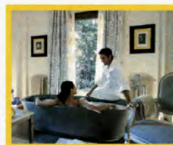
Urban SPA Four Seasons Hotel Firenze