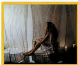
Urban SPA Aquae Calidae