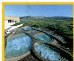
Destination SPA Verdura SPA Golf & Resort