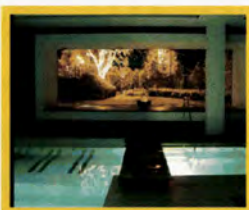
Eco SPA Hotel Milano