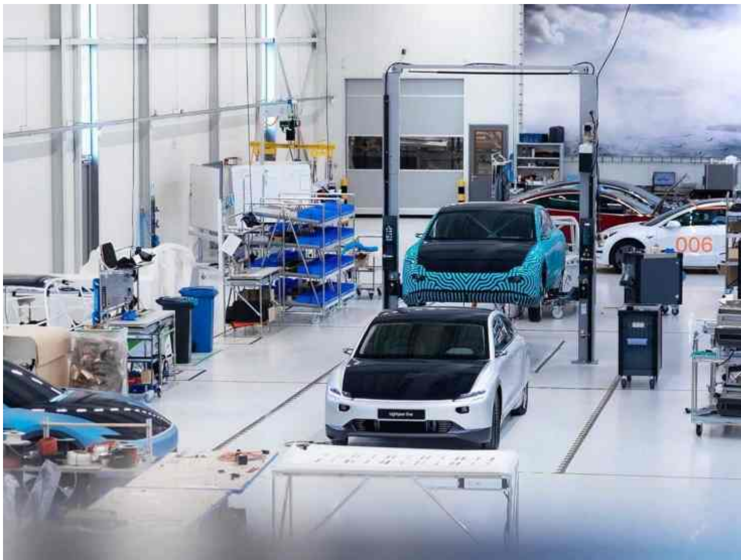
Fabbrica Lightyear One

Bridgestone , tuttavia, non si è dimenticata del settore dal quale proviene, e quindi ecco due nuove gomme , una per le automobili, e l'altra per le moto. Partendo da quella per le macchine , ecco le nuove Turanza Eco , progettate e prodotte per la Lightyear One , ovvero la prima macchina a energia solare del mondo, tale da poter coprire un alto range di chilometri .