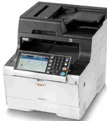
La multifunzione MC573

possibile effettuare la distribuzione simultanea di materiale promozionale ai negozi di una catena retail, senza richiedere la presenza di un computer presso il punto vendita.