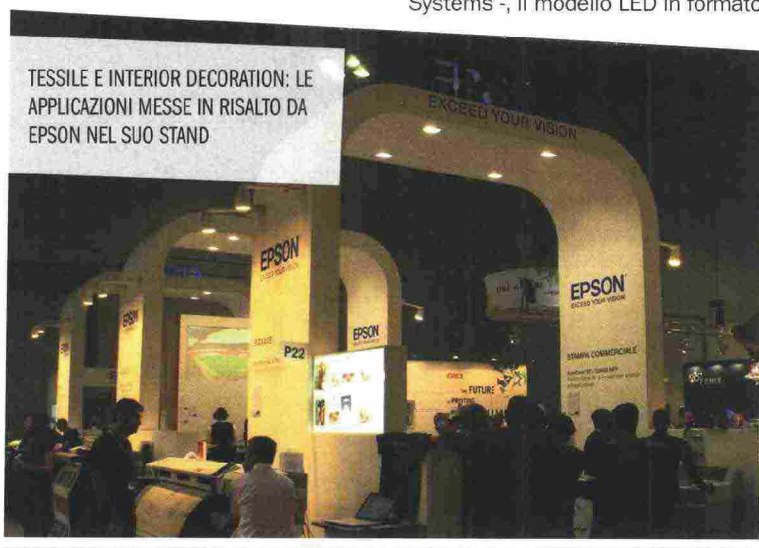
TESSILE E INTERIOR DECORATION: LE APPLICAZIONI MESSE IN RISALTO DA EPSON NEL SUO STAND