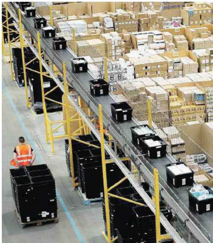
L'interno di uno deposito di Amazon