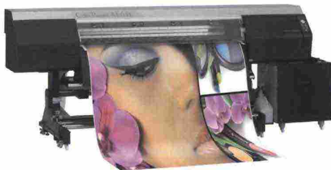
ColorPainter M-64s - LCIS

Il portafoglio OKI di stampanti di grande formato a getto d'inchiostro è basato su sistemi di stampa di elevata precisione in grado di fornire una qualità e una produttività tale da renderli ideali per applicazioni per interni ed esterni, inclusi striscioni, grafica retroilluminata, grafica su automezzi e veicoli, wallpaper, espositori, grafica per eventi, mostre e molto altro. All'interno della gamma di stampanti a colori ad alta velocità ColorPainter, vi sono i modelli M-64s LCIS, H3-104s e E-64s