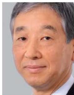
Takao Hiramoto, Presidente di OKI Data Corporation.

Più di 100 milioni di dollari (all'incirca 77 milioni di euro) sono stati spesi globalmente nel settore delle stampanti white & clear. Questo risultato, non