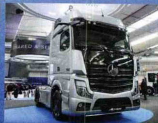
Mercedes, l'anteprima L'Actros 2019 con guida assistita di secondo livello e telecamere al posto degli specchi è arrivato a sorpresa a Verona.