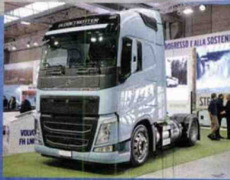
Volvo, il ritorno Prima presenza dopo tante edizioni per la casa svedese, che ha naturalmente mostrato l'FH-460 LNG a metano liquido.